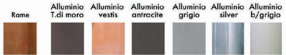
Cod. K (rete)